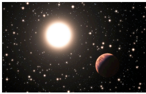
Vue d'artiste d'une exoplanète orbitant autour d'une étoile jumelle du Soleil dans l'amas Messier 67.

Sur le millier d'exoplanètes découvert à ce jour, seul un tout petit nombre a été décelé au sein d'amas d'étoiles. Six années de recherches auront été nécessaires à une équipe européenne impliquant un chercheur CNRS du laboratoire Galaxies, Etoiles, Physique et Instrumentation - GEPI 1 à l'Observatoire de Paris (Observatoire de Paris/CNRS/Université Paris Diderot) pour passer en revue un échantillon important d'étoiles au sein de l'amas Messier 67 et mettre au jour trois exoplanètes. Et, fait remarquable, l'une d'entre elles orbite autour d'une étoile quasi identique au Soleil. Ce résultat marque un tournant dans la recherche des exoplanètes, rendant leur quête possible de façon plus systématique dans les amas d'étoiles. Il laisse aussi entrevoir de nouveaux scénarios sur la formation et l'évolution de systèmes planétaires autour d'étoiles comme le Soleil. Ces travaux sont publiés le 15 janvier dans la revue Astronomy & Astrophysics .