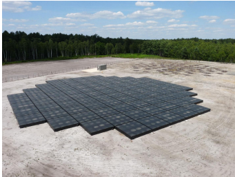
Station française de LOFAR à Nançay